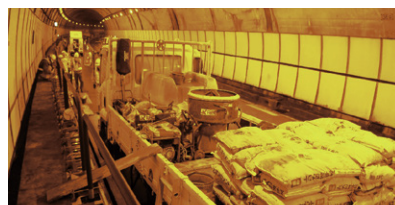
充填モルタル練り混ぜ