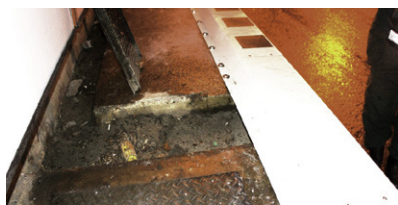
監視員通路上面水路、縦排水流入部