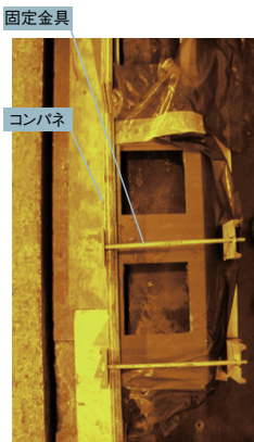
コンパネ固定金具取付状況 (上面)