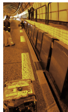
パネル取付班作業状況