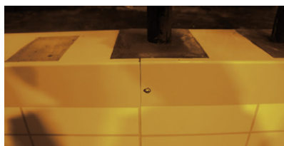
支柱部開口、パネルジョイント