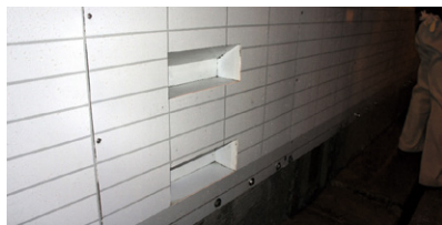
消火栓部ステップ