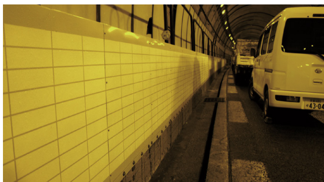
トンネル内取付状況