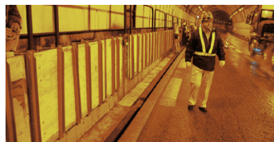
コンパネ取付状況