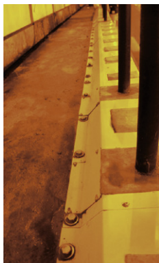
監視員通路上部 (支柱部取合い)