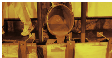
充填モルタル流し込み状況 硬化時間3時間