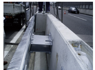
既設防護柵すり付け状況