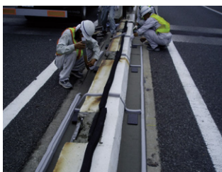
シール材貼り付け グラウト漏れ防止対策