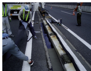
ゴムシート貼り付け(緩衝材)