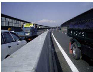
据付状況 32m/日 昼間規制