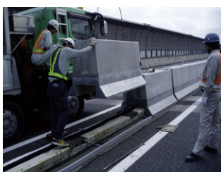
製品据付 2.9t吊ユニック車