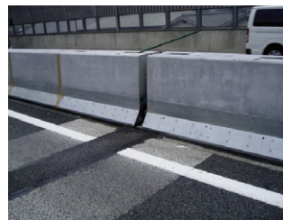
橋梁伸縮部 15cmの干渉部