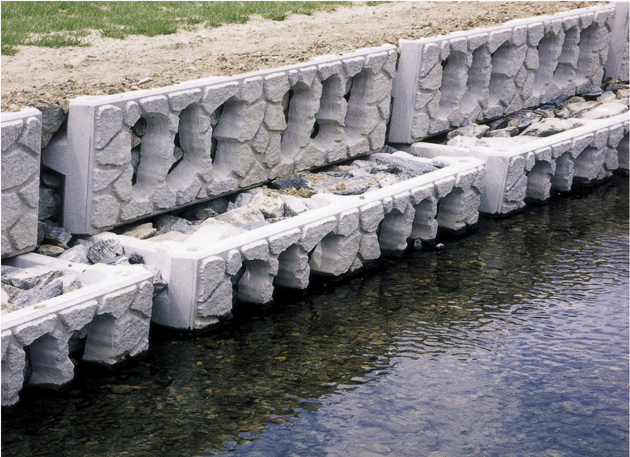
兵庫県(竜野土木)揖保川 水系 管野川

※取扱地域が記載されていない地域については、担当営業所 (P488) にお問い合わせください。